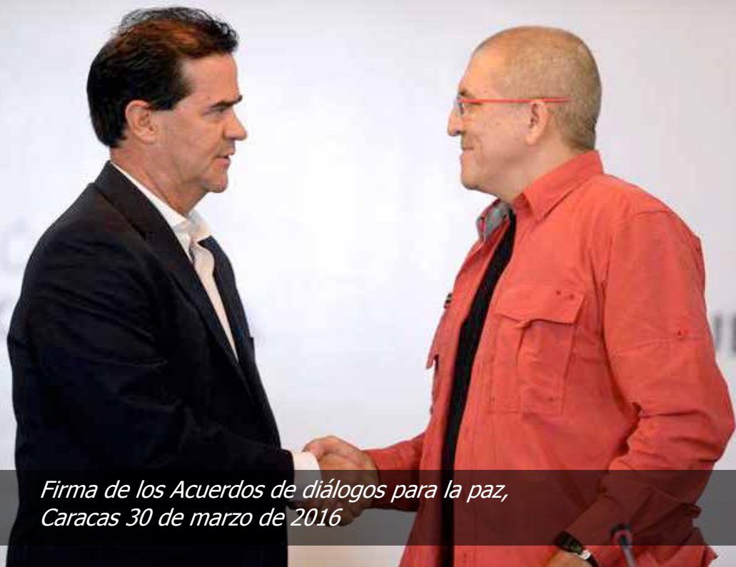
Firma de los Acuerdos de diálogos para la paz, Caracas 30 de marzo de 2016