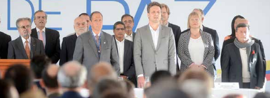
Instalación de la fase pública de Diálogos entre el Gobierno Colombiano y el ELN, Quito 7 febrero de 2017