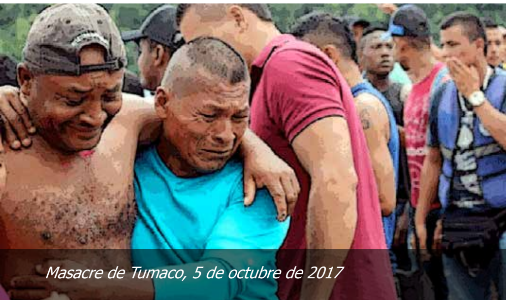
Masacre de Tumaco, 5 de octubre de 2017